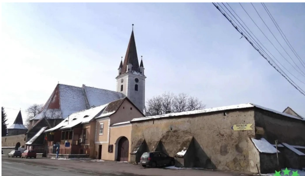
Cristian aproape de mine