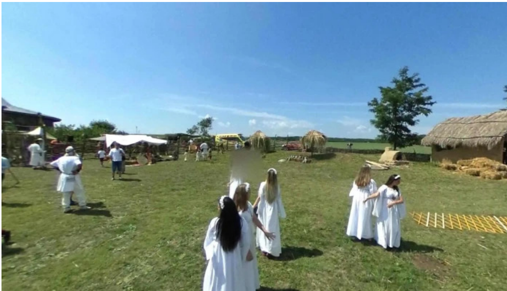
Cucuteni street view si 360deg