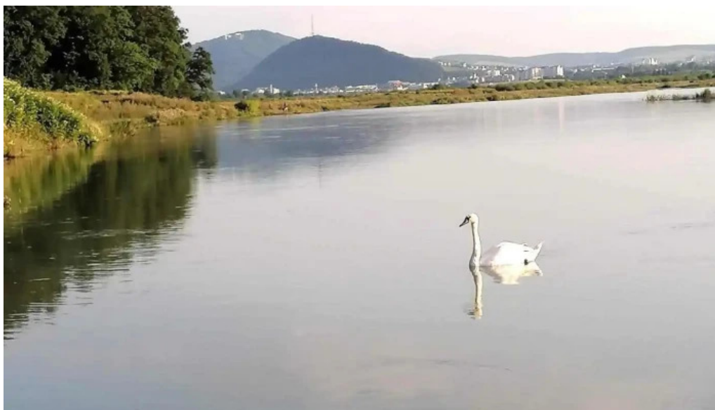
Cut aproape de mine