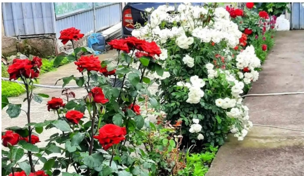
Cuza voda site web