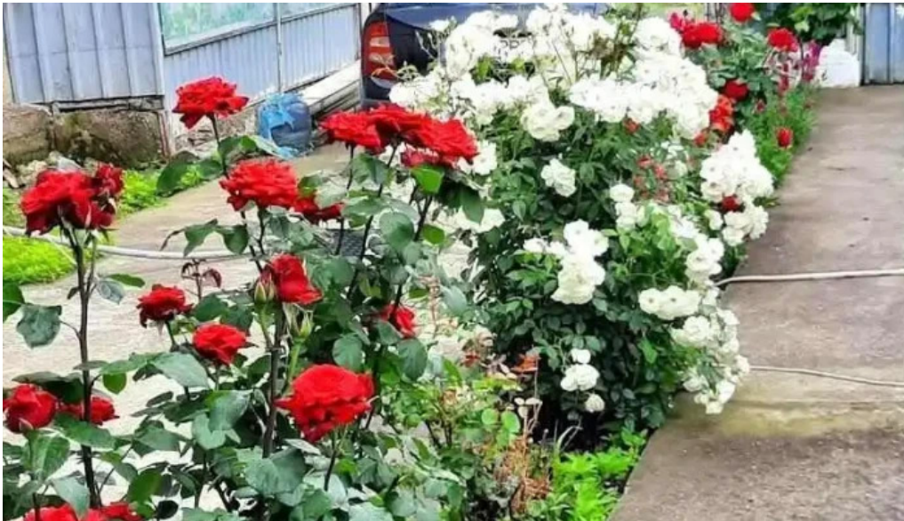
Cuza vod? cuza vod?