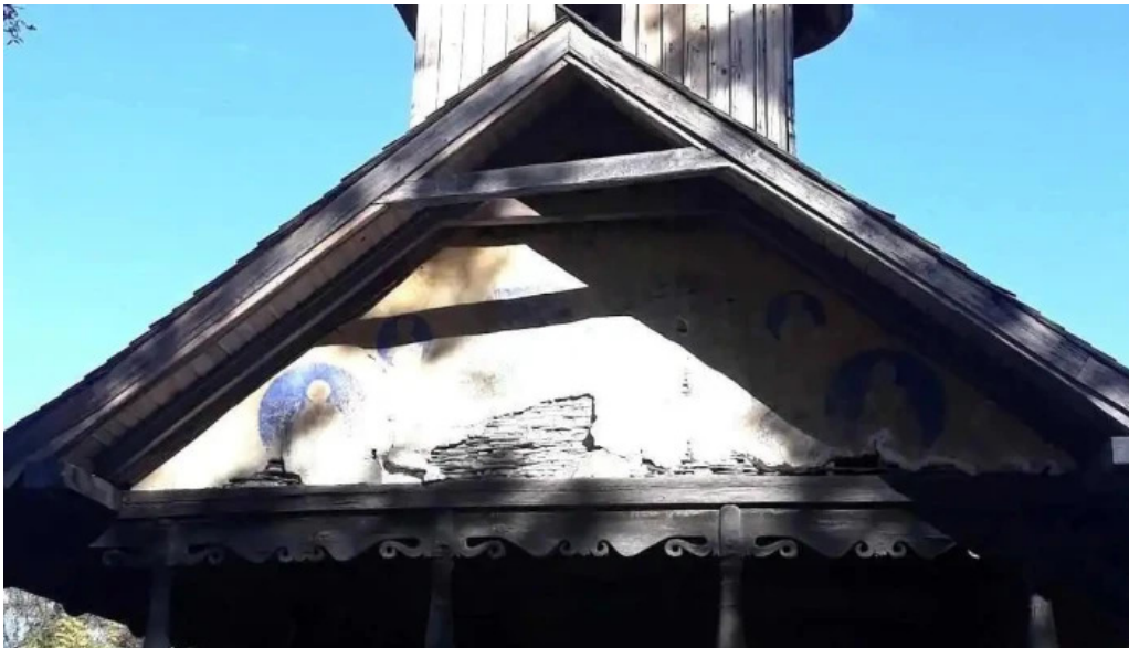
Capsuna site web