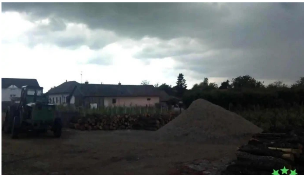
Galicea mare galicea mare