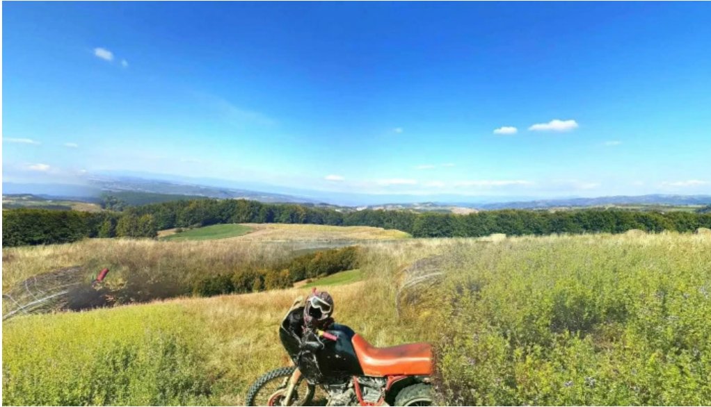
Hovrila street view si 360deg