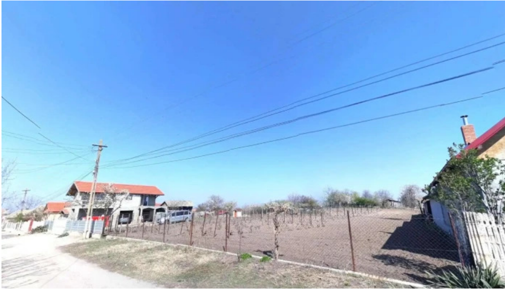
Hunia street view si 360deg