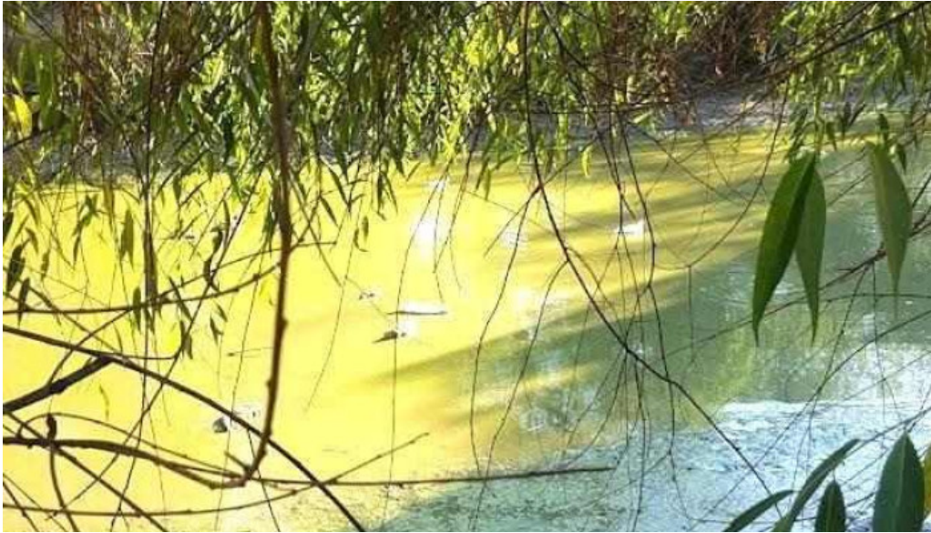
Lunca cet??uii lunca cet??uii