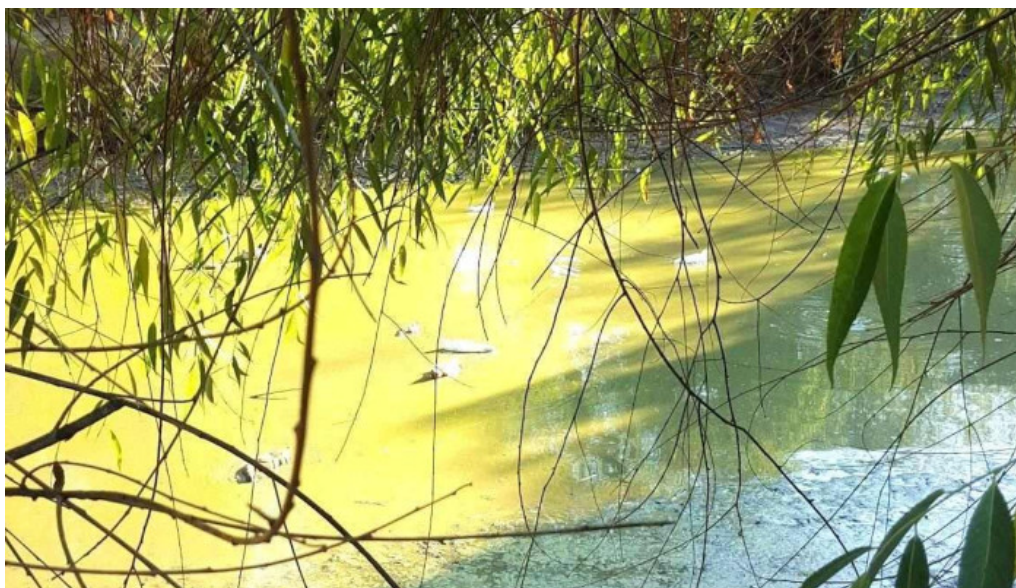
Lunca cetatuii adres?