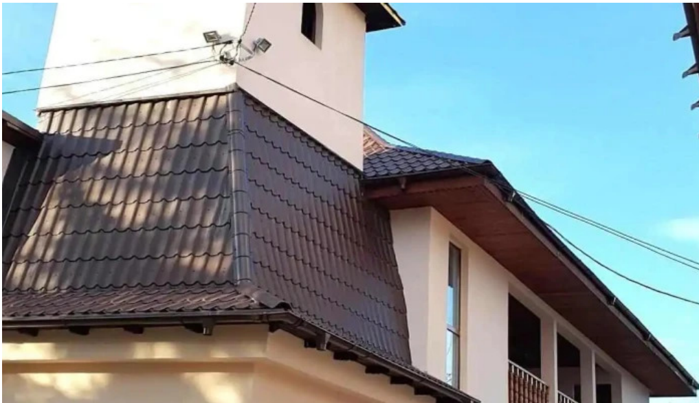
Poduri deschis acum