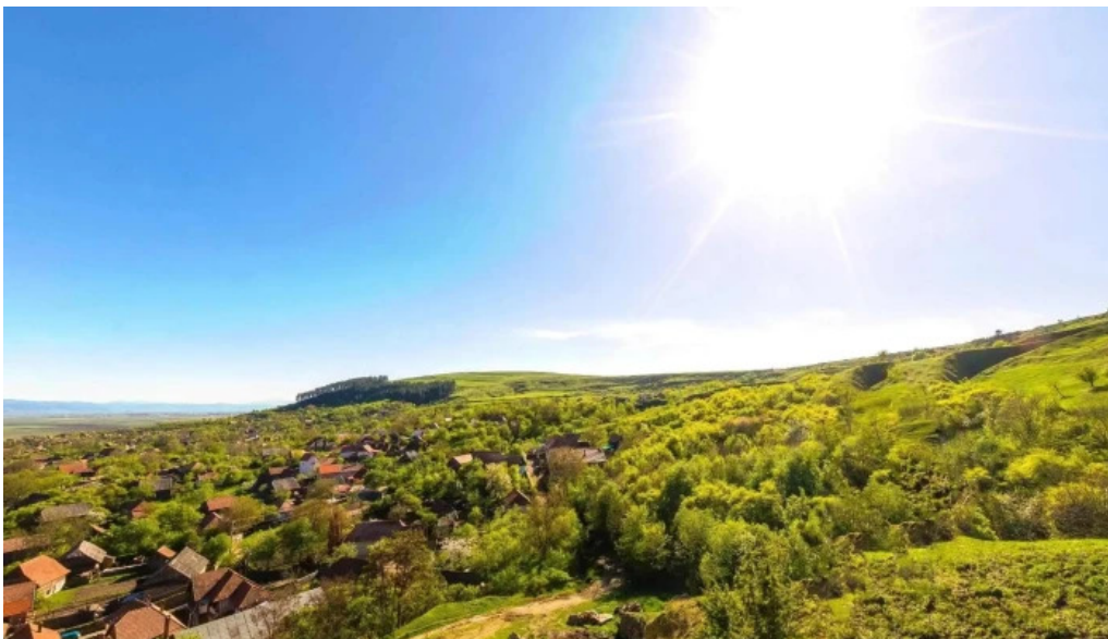
Poian street view si 360deg