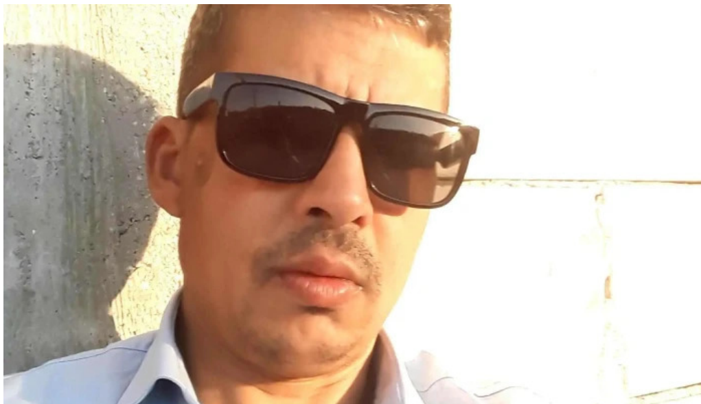
Consiliul local potlogi potlogi