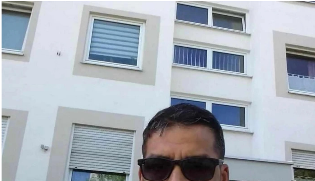
Consiliul local potlogi unde