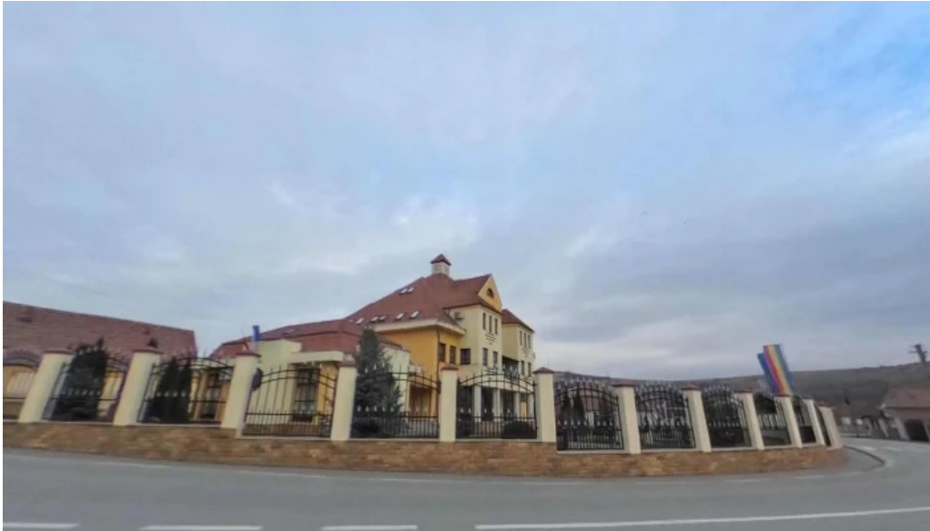
Pauca street view si 360deg