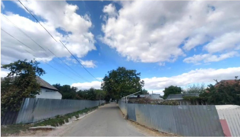
Paunesti street view si 360deg