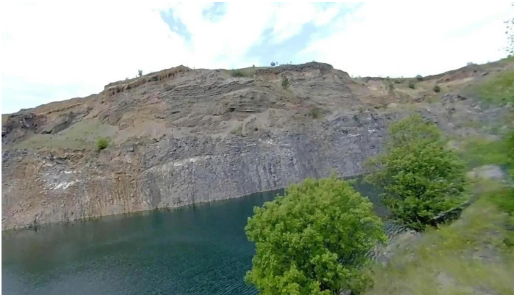
Racos street view si 360deg