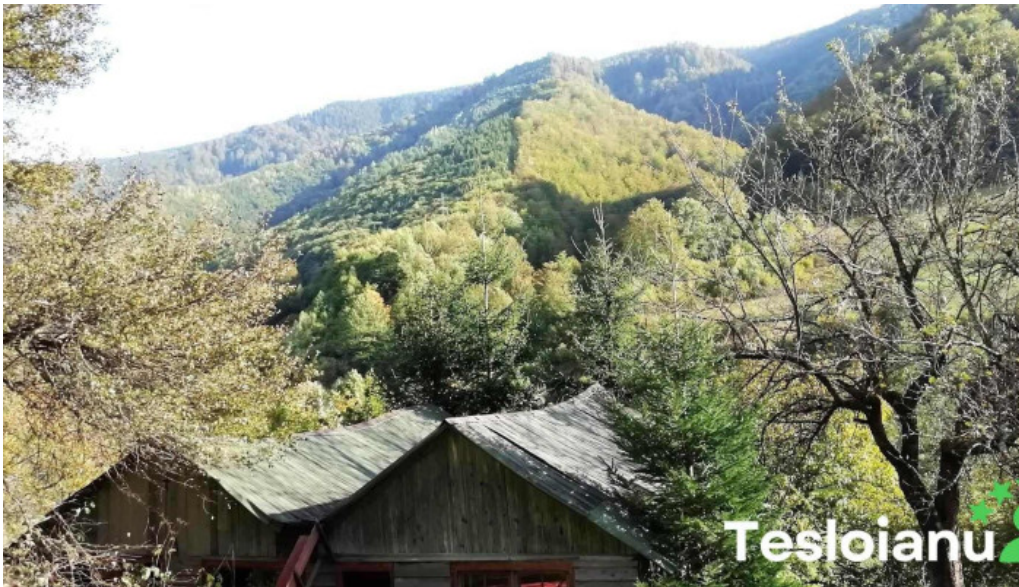
Rau sadului reduceri