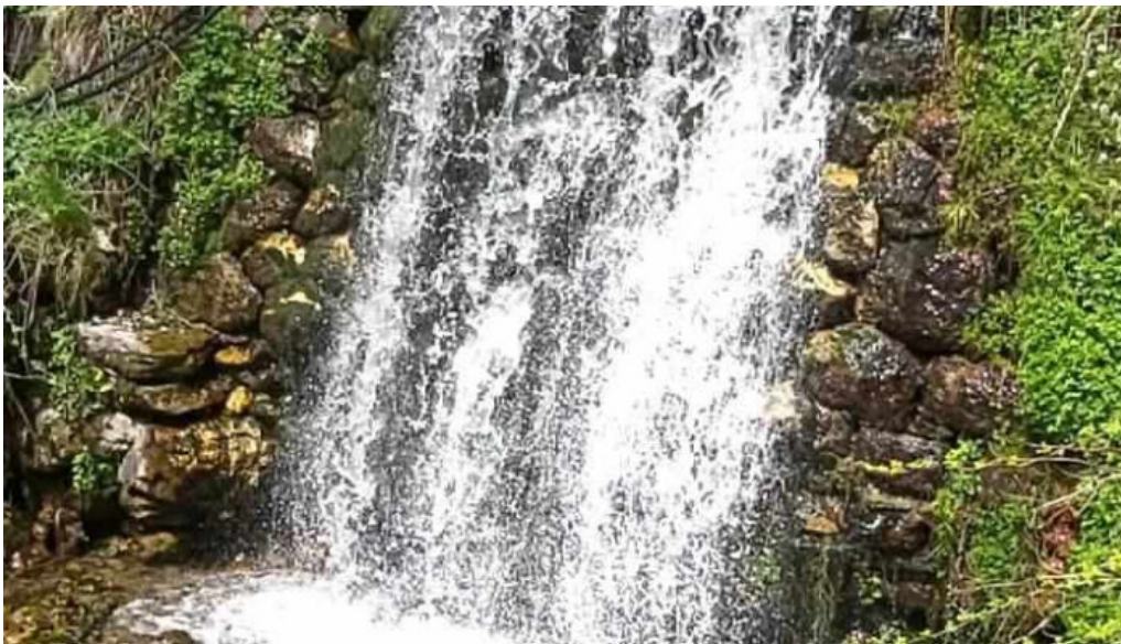
Rau sadului videoclipuri