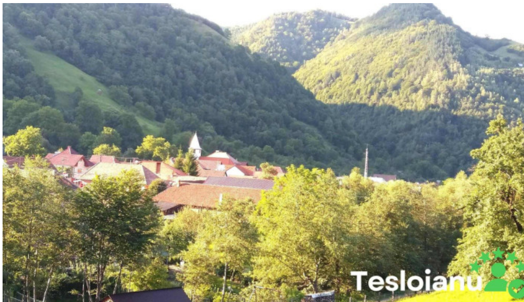
Rau sadului munte