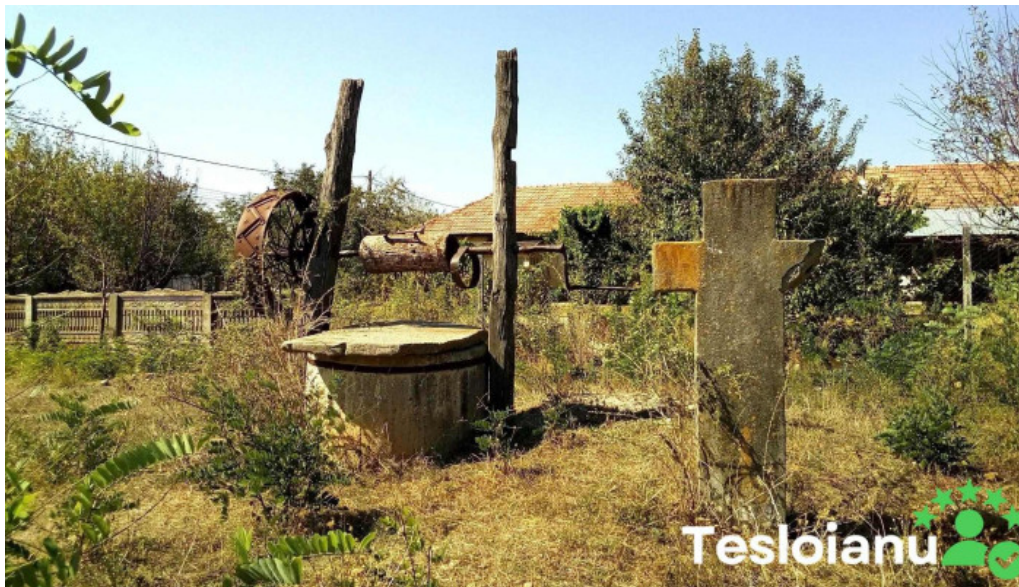
Redea site web