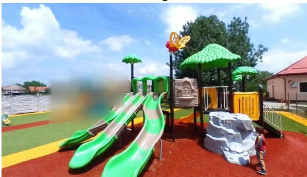
Remetea mare street view si 360deg