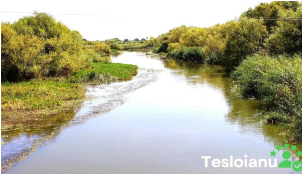
Remetea mare num?r