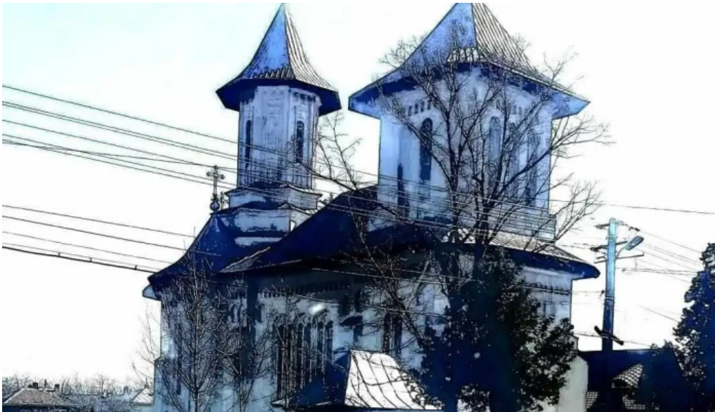
Ripiceni vechi cum s? ajungi acolo