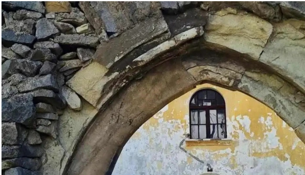
Rodna site web