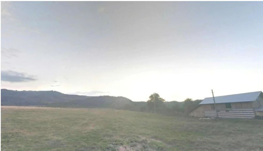
Comuna albestii de arges zon?