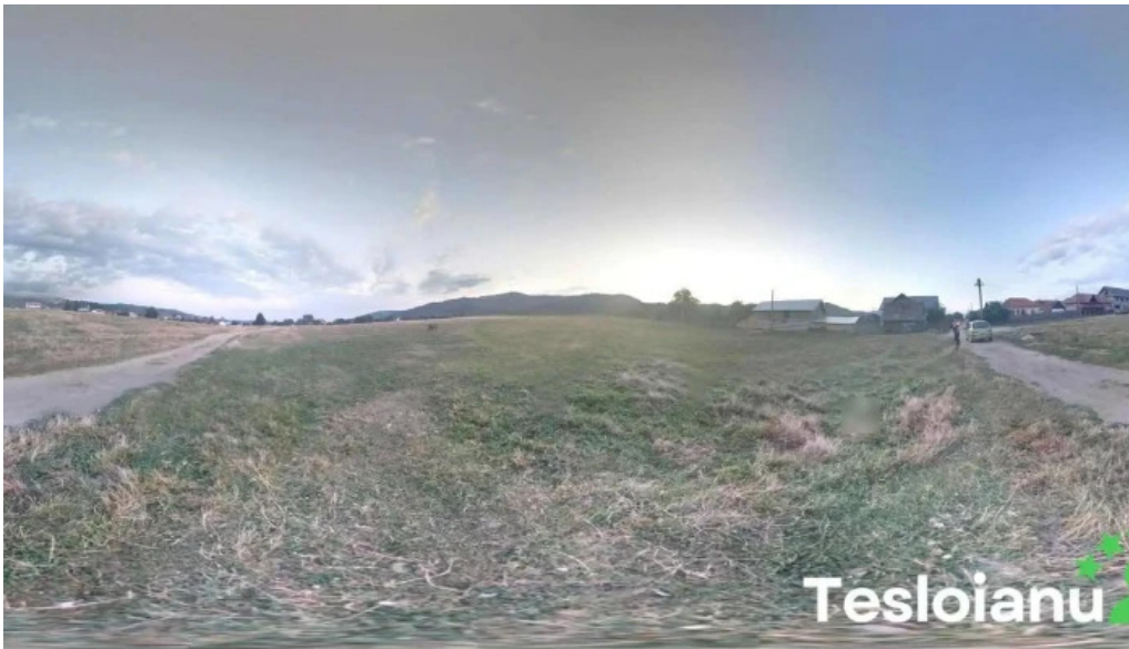
Comuna albe?tii de arge? romania