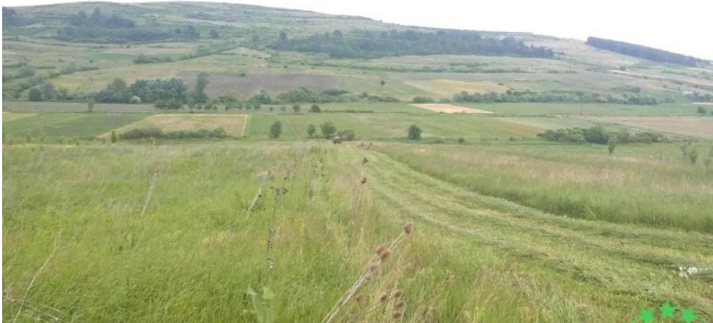
Comuna alunis recenzii