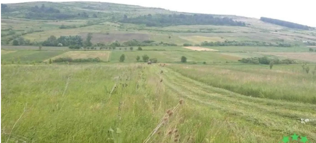
Comuna aluniș romania