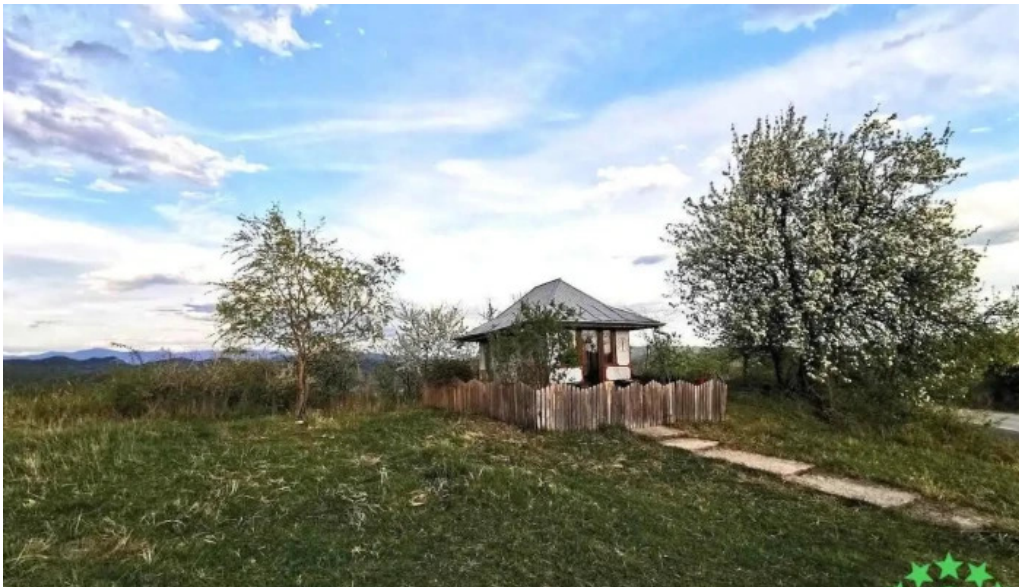
Comuna aninoasa romania