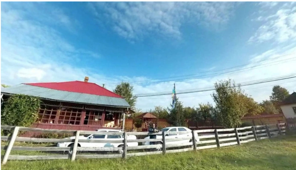
Comuna aninoasa street view si 360deg