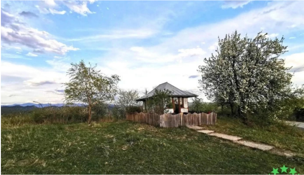
Comuna aninoasa site web