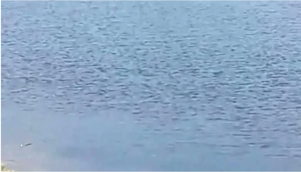
Comuna apa romania