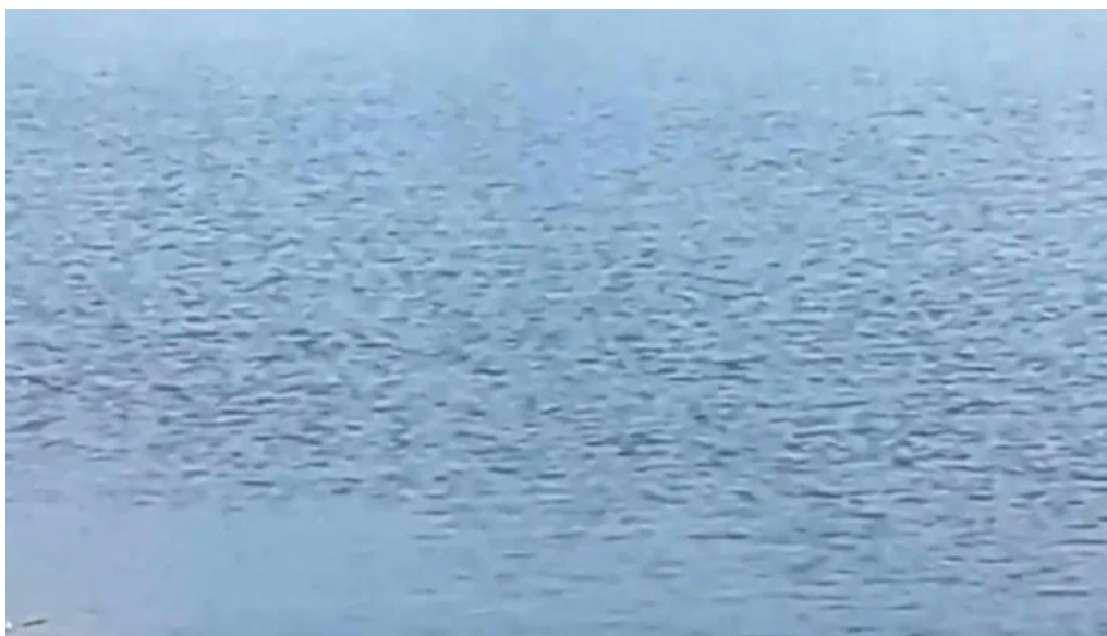
Comuna apa catalog