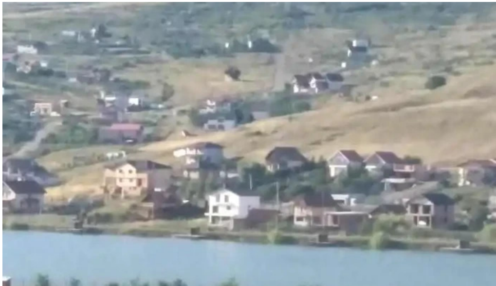
Comuna apahida romania