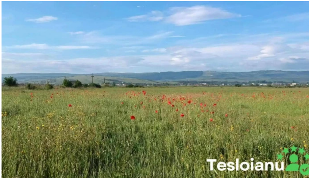
Comuna apahida videoclipuri