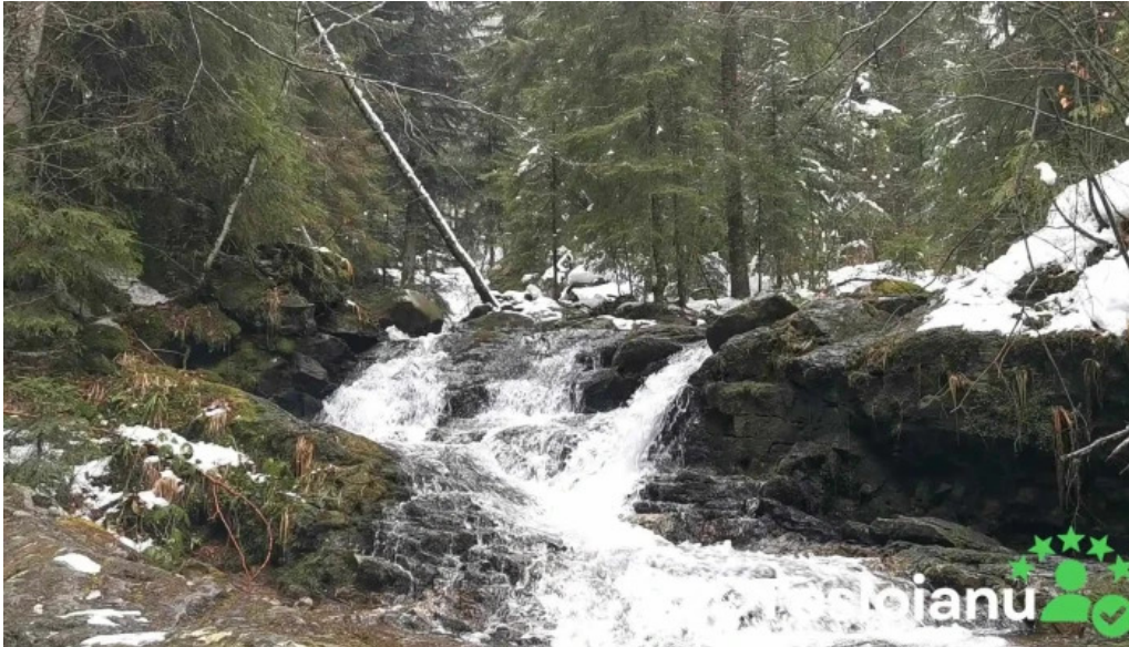
Comuna arieseni videoclipuri