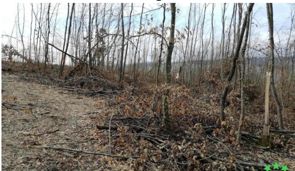
Comuna așchileu romania