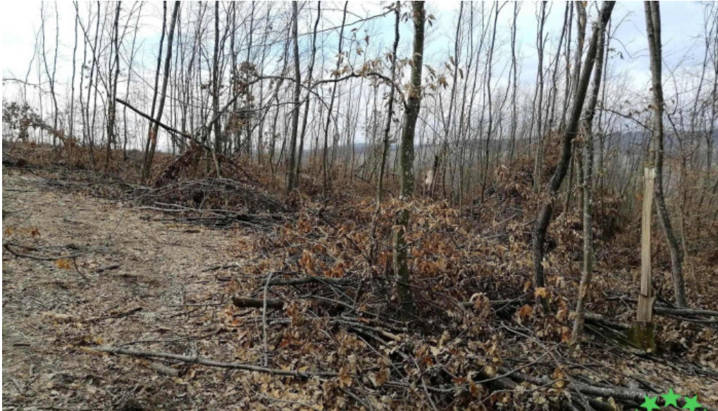
Comuna aschileu zon?