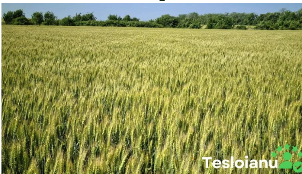
Comuna balta doamnei videoclipuri