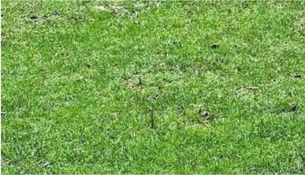
Comuna balta doamnei romania