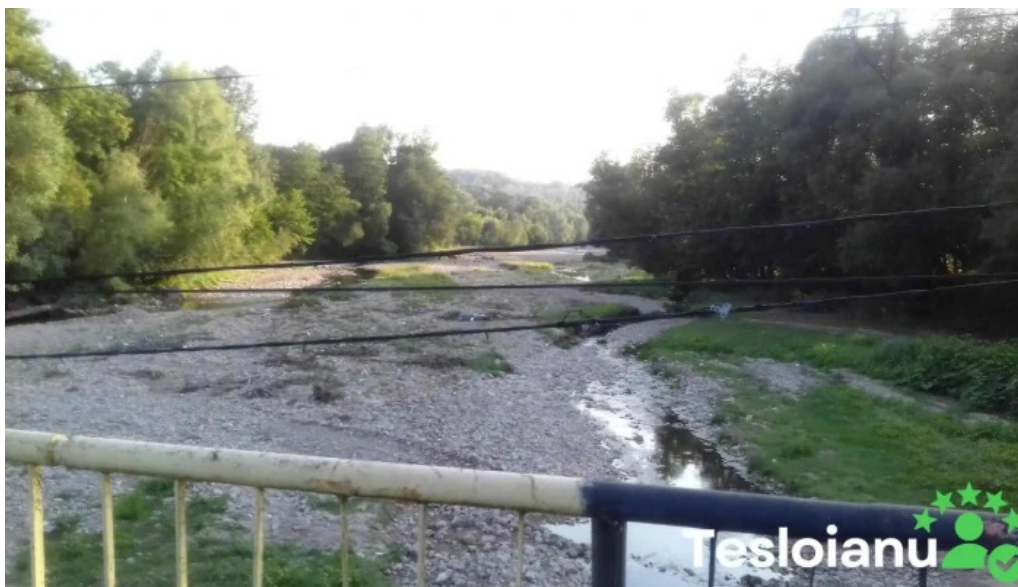
Comuna bezdead reduceri