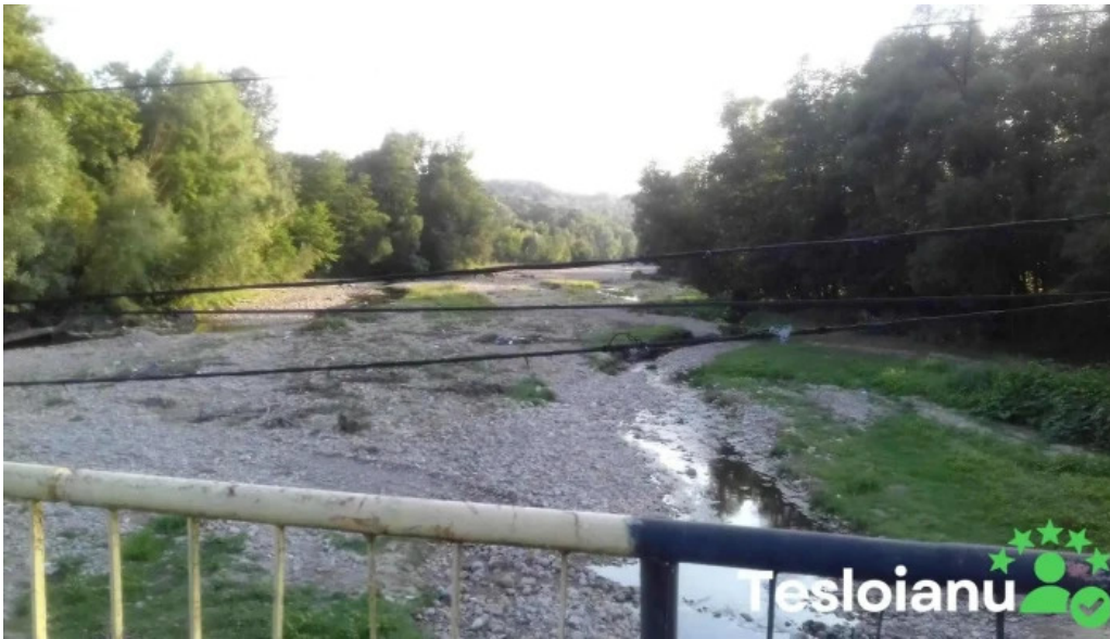
Comuna bezdead romania