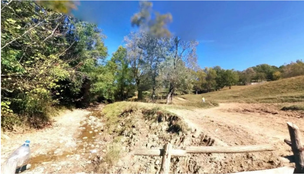
Comuna bezdead street view si 360deg