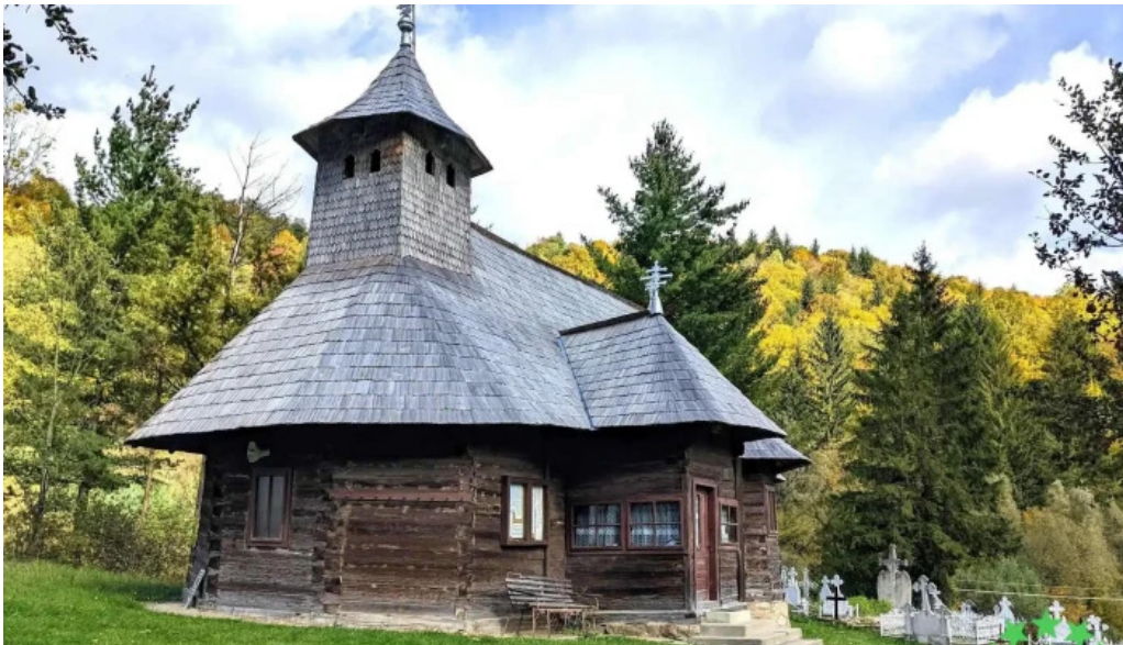
Comuna bicazu ardelean program