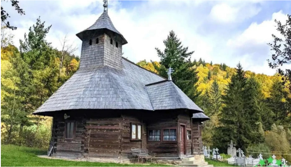
Comuna bicazu ardelean romania