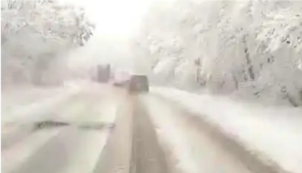
Comuna blajel videoclipuri