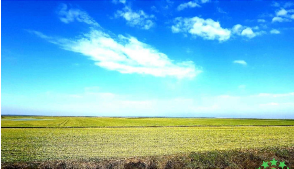
Comuna bragadiru romania