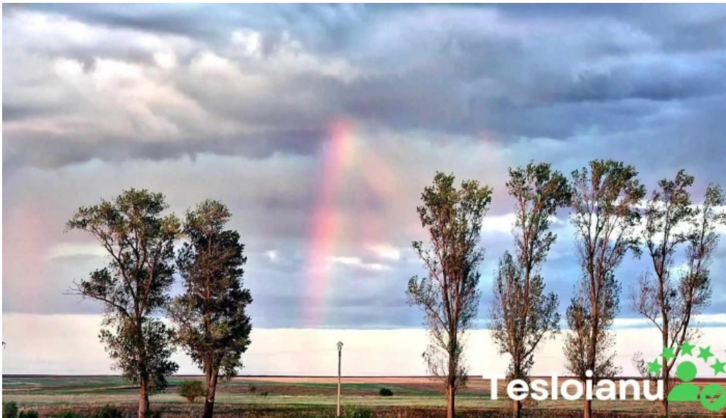
Comuna bragadiru videoclipuri