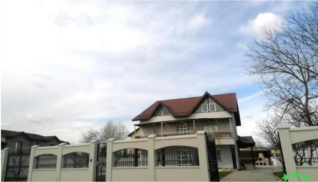
Comuna br?ne?ti romania