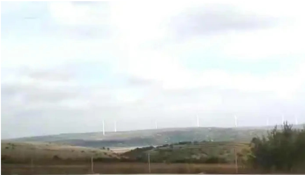
Comuna branesti videoclipuri