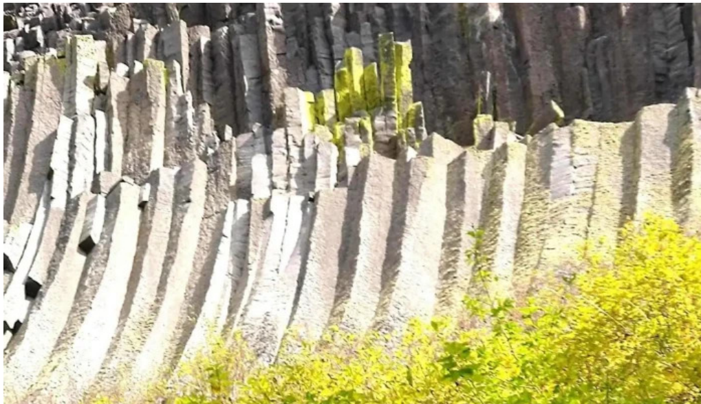
Comuna bucium fotografii