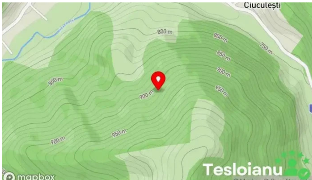
Comuna bucium hart?