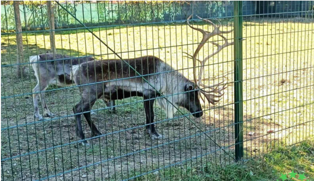
Comuna buciumi aproape de mine