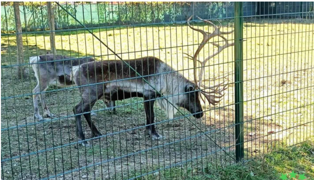
Comuna buciumi romania