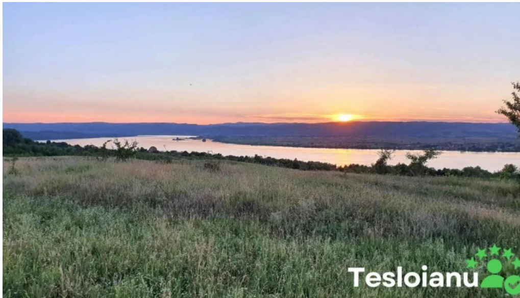
Comuna burila mare mare