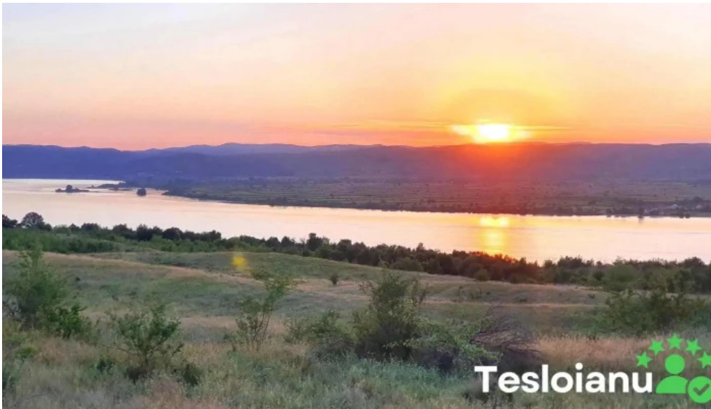
Comuna burila mare site web