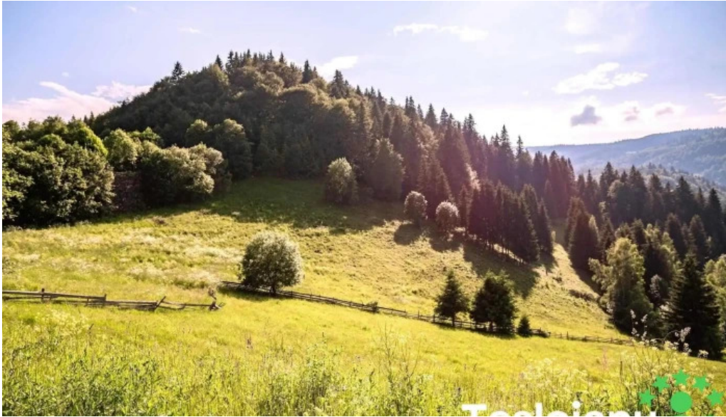
Comuna baisesa fotografiei