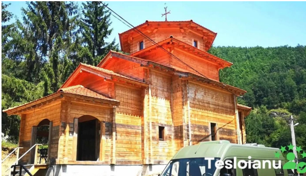
Comuna baisesara videoclipuri