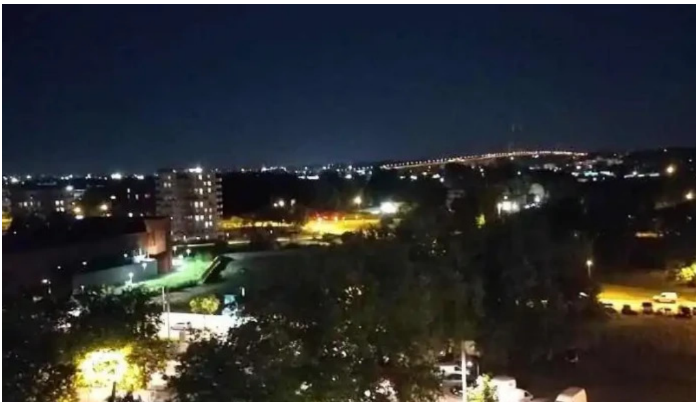
Comuna b?rbule?ti romania