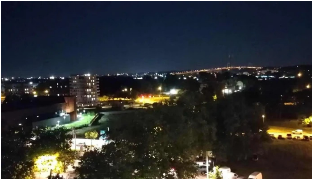
Comuna barbulesti loca?ie