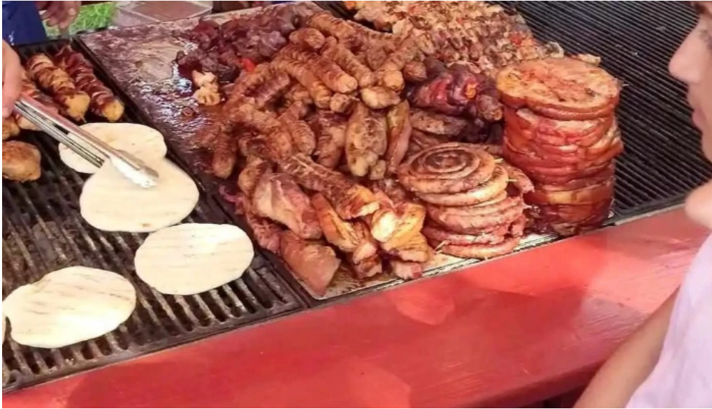
Comuna barbulesti videoclipuri