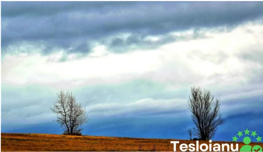
Comuna batani romania