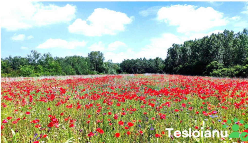
Comuna calopar promo?ie