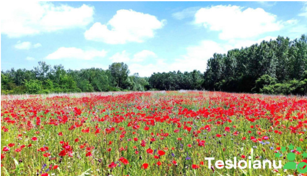
Comuna calop?r romania