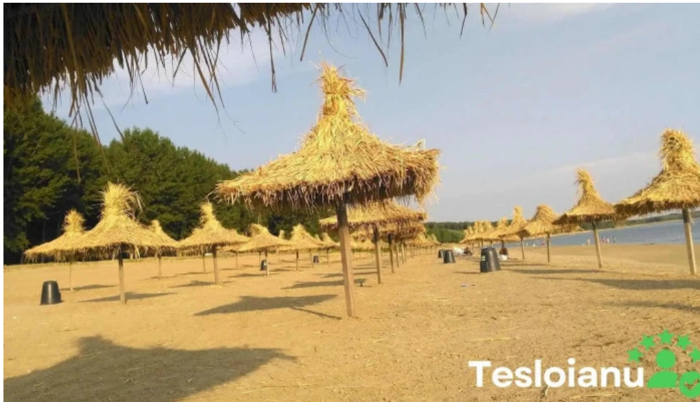
Comuna cetate num?r