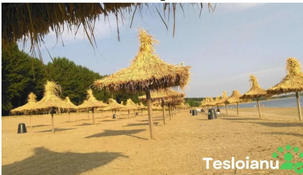
Comuna cetate romania