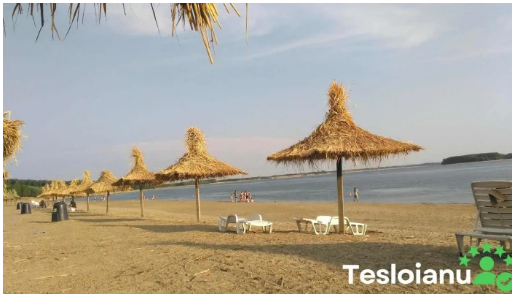
Comuna cetate mare