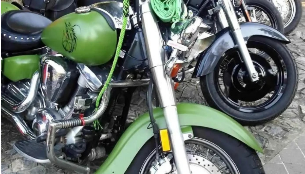
Comuna cheveresu mare zon?