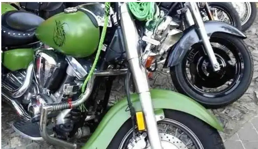
Comuna chevereu mare romania