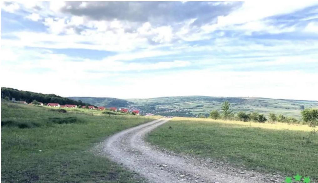
Comuna chinteni deschis acum