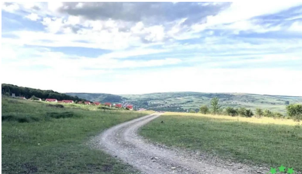
Comuna chinteni romania