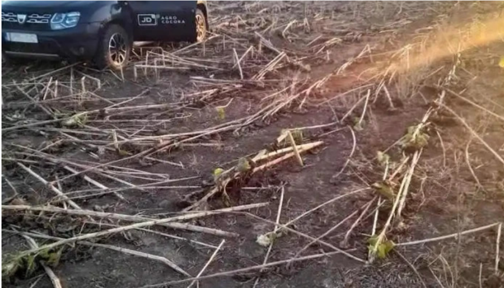
Comuna chirnogeni romania