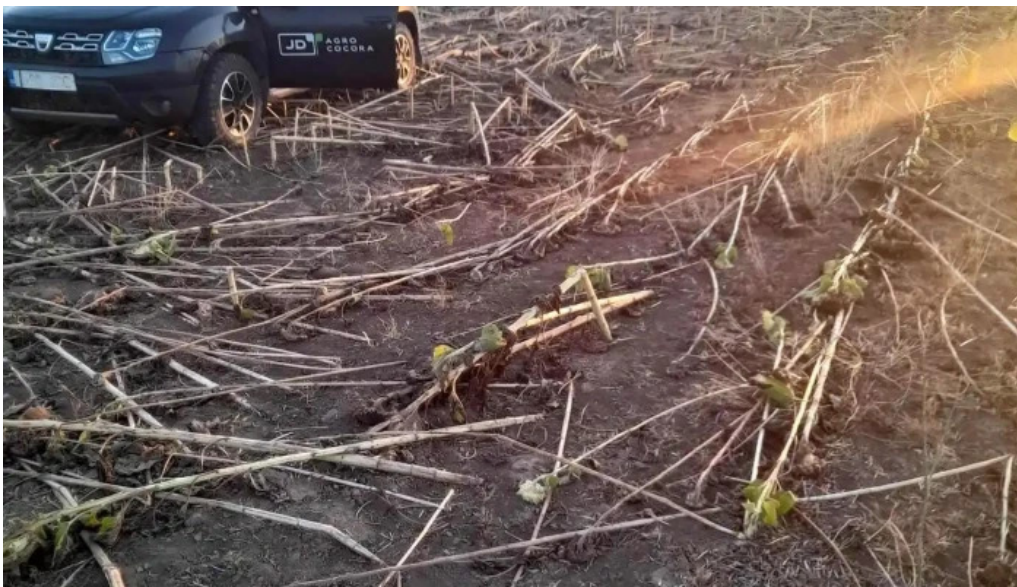
Comuna chirnogeni scor