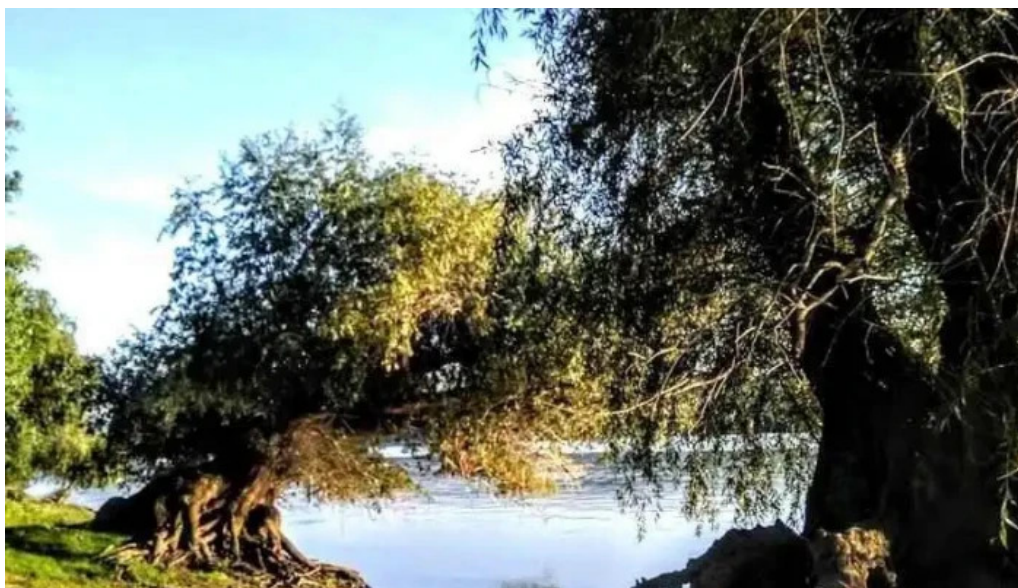
Comuna ciupercenii noi romania