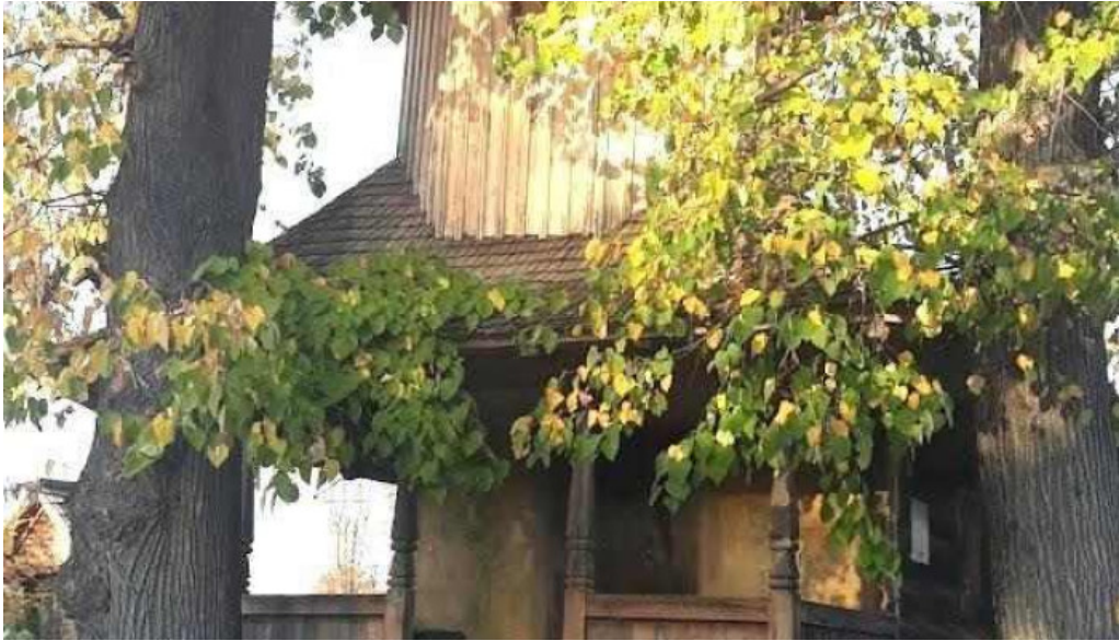
Comuna cobia romania