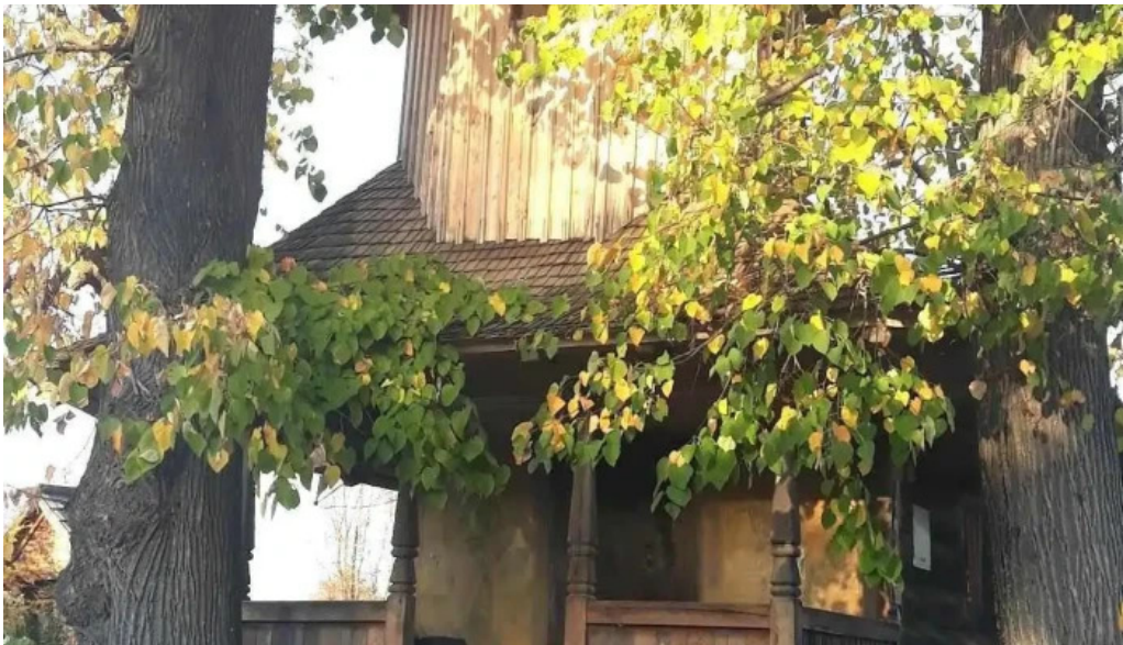
Comuna cobia loca?ie