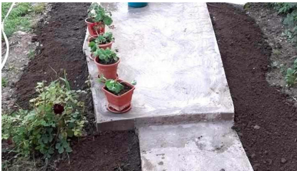
Comuna codaesti loca?ie