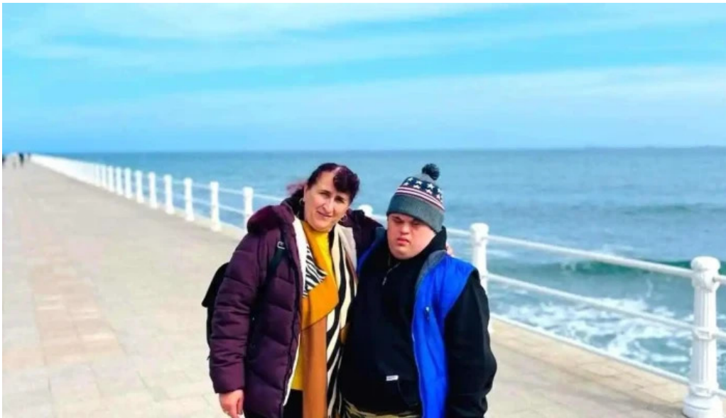
Comuna codaesti mare