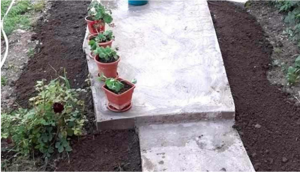
Comuna cod?e?ti romania