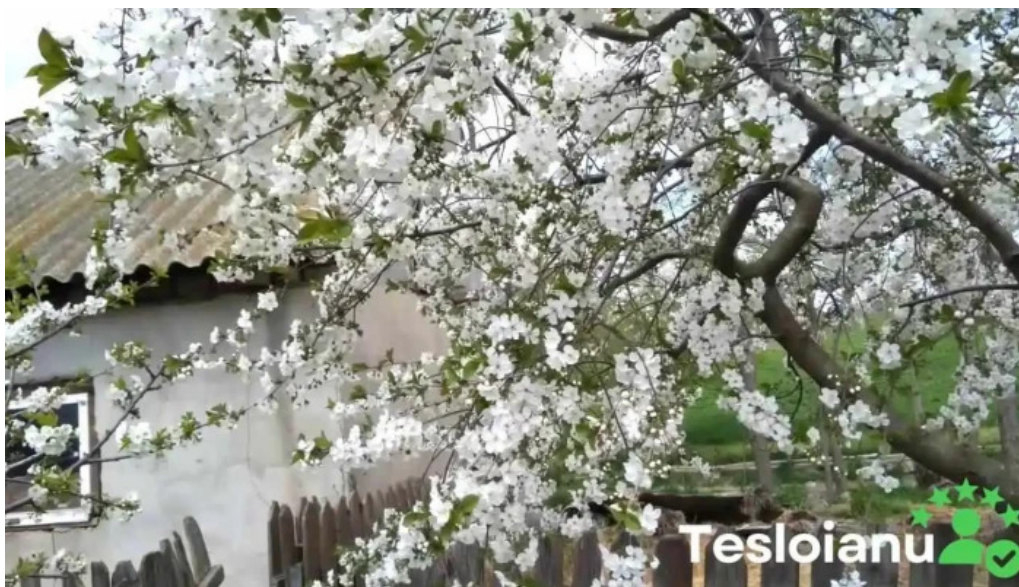
Comuna cogealac reduceri