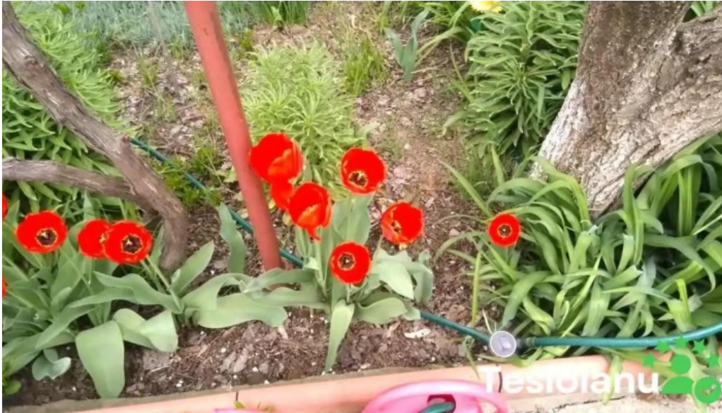
Comuna cogeaalac videoclipuri