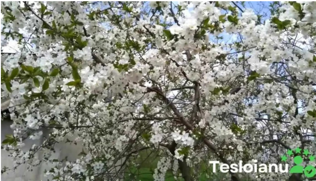
Comuna cogeaalac romania