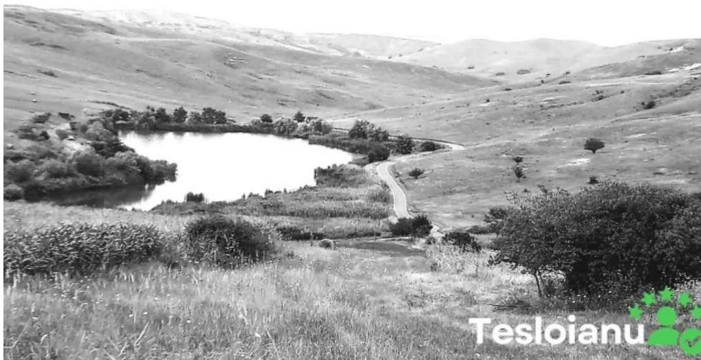
Comuna cojocna romania