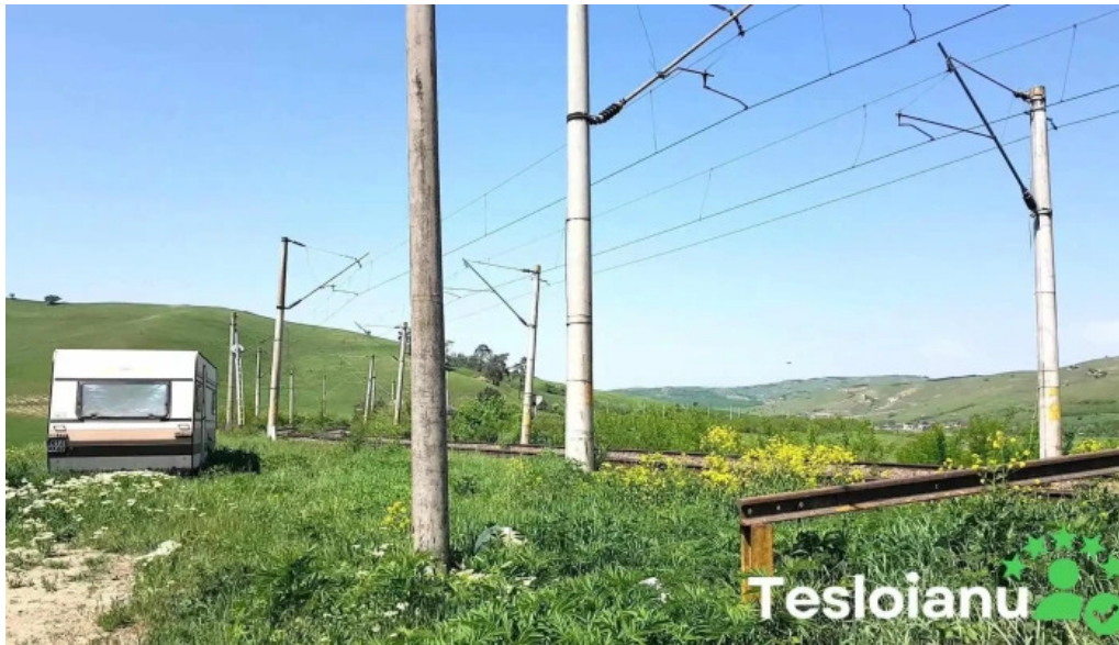
Comuna cojocna videoclipuri