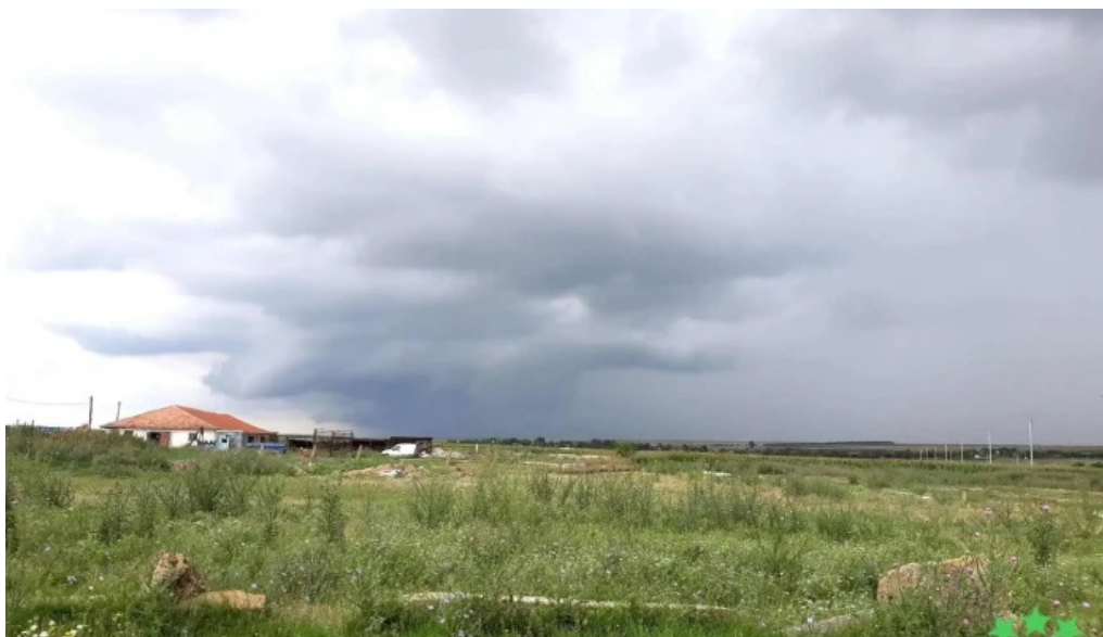
Comuna comana fotografii