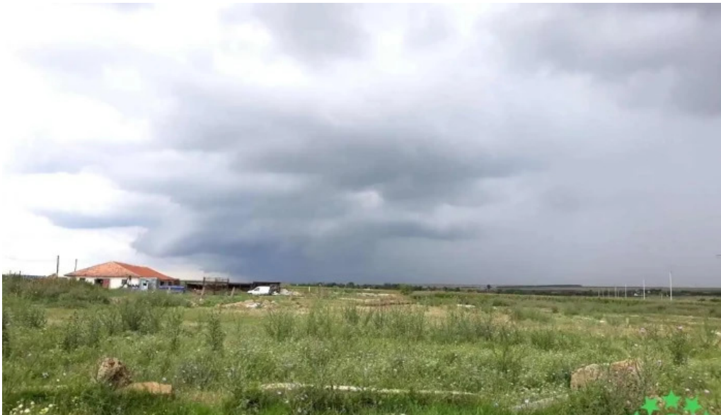
Comuna comana romania